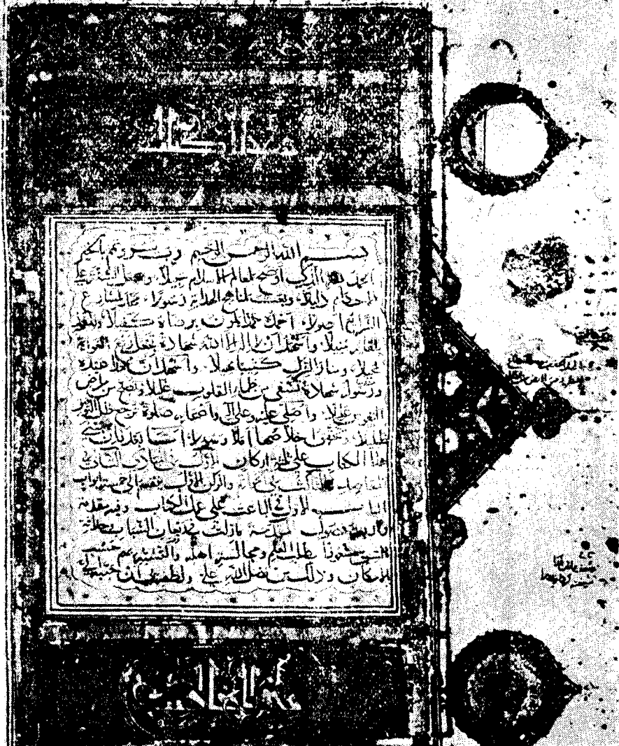
راموز الصفحة الأولى من النسخة الأولى التامة

هَذَا مَا وَقَفَهُ الْوَزِيرُ الْعَظِيمُ وَالْمُسَيَّرُ الْعَمَامُ مَعَ الْبَرَاتِ وَالْمَبْرُورِ وَمَعَهُ